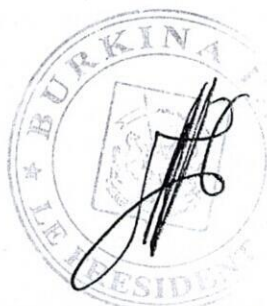
Capitaine Ibrahim TRAORE